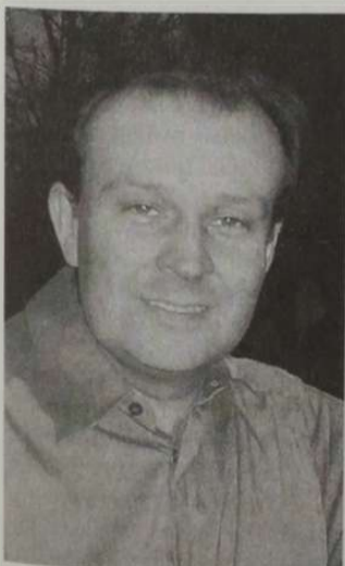
Gough húsz évig gyűjtött anyagot

III. RICHARD Egy angol író az angol király modern kori megfelelőjeként említette a magyar párt első emberét